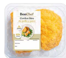
Cordon Bleu de pollo y pavo