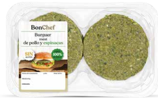
Burger meat de pollo y espinacas