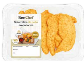
Solomillos de pollo