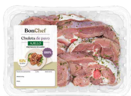
Chuleta de pavo al ajillo