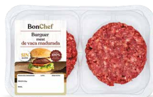
Burger meat de vaca madurada