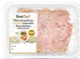
Filete de pechuga de pollo marinado finas hierbas