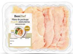
Filete de pechuga de pollo extra tierna