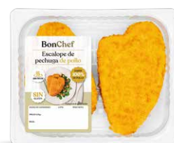
Escalope de pechuga de pollo