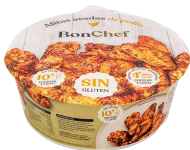
Alitas asadas de pollo