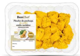
Pincho de pechuga de pollo estilo andaluz