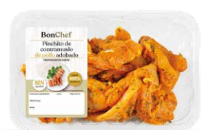
Pinchito de contramuslo de pollo adobado