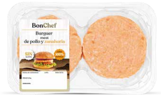
Burger meat de pollo y zanahoria