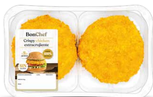
Crispy chicken extracrujiente