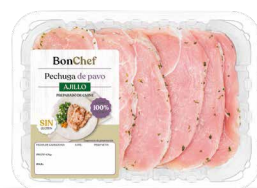
Pechuga de pavo al ajillo