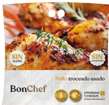
Pollo troceado asado