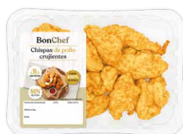
Chispas de pollo