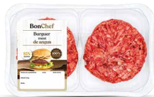
Burger meat de angus