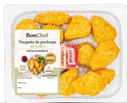
Nuggets de pechuga de pollo