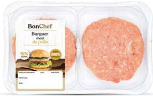
Burger meat de pollo