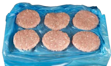
Burger meat de pollo 100 g/u. congelada