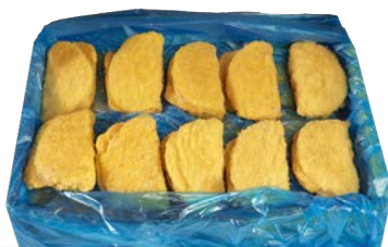
Cordon bleu de pollo y pavo congelado