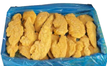
Solomillos de pollo empanados congelados