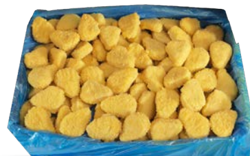
Nuggets de pechuga de pollo congelados