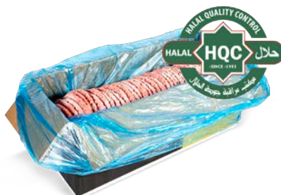
Hamburguesa de vacuno 113 g/u. congelada