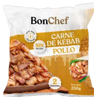
Carne de kebab de pollo