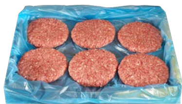
Hamburguesa de vaca madurada 150 g/u. congelada