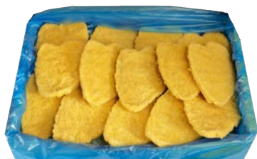
Escalope de pechuga de pollo congelado