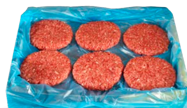
Burger meat de vacuno 150 g/u. congelada