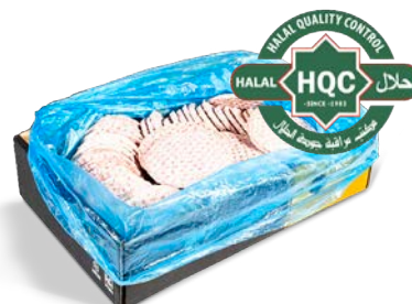
Hamburguesa de vacuno 50 g/u. congelada