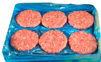
Burger meat de angus 180 g/u. congelada