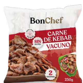
Carne de kebab de vacuno