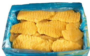
Pechuga de pollo empanada con ajo y perejil congelada