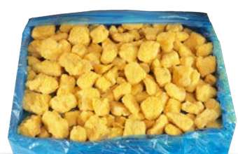
Chispas de pollo crujientes congeladas