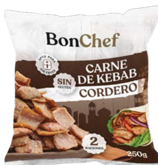
Carne de kebab de cordero