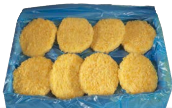
Crispy chicken congelado