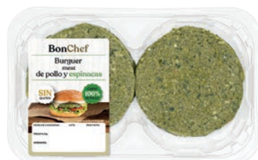
Burger meat de pollo y espinacas