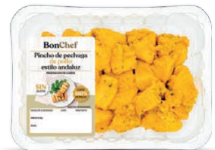
Pincho de pechuga de pollo estilo andaluz