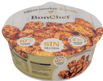
Alitas asadas de pollo