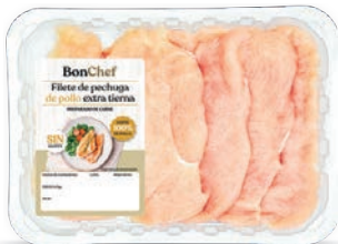
Filete de pechuga de pollo extra tierna