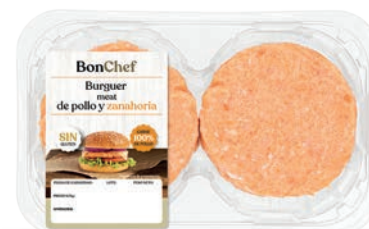
Burger meat de pollo y zanahoria