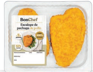
Escalope de pechuga de pollo