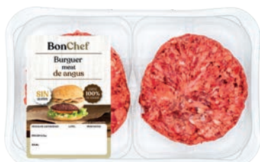
Burger meat de angus