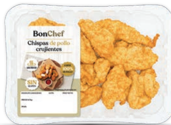
Chispas de pollo