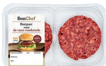
Burger meat de vaca madurada