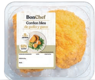
Cordon Bleu de pollo y pavo