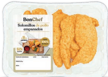
Solomillos de pollo