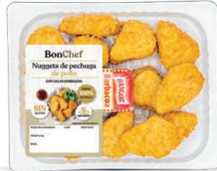
Nuggets de pechuga de pollo