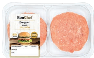
Burger meat de pollo