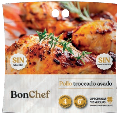
Pollo troceado asado