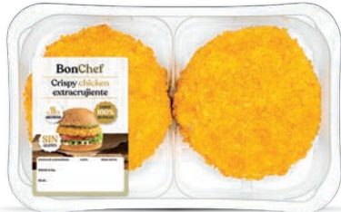
Crispy chicken extracrujiente