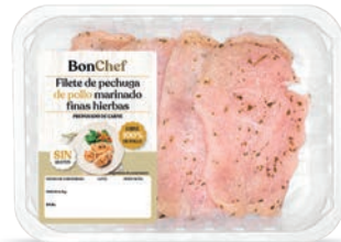
Filete de pechuga de pollo marinado finas hierbas